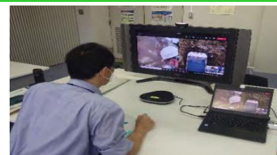
技術者が、カメラ映像を確認し、現場へ指示